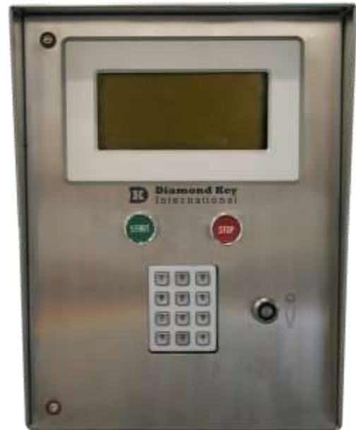
型号 RDI-II-GI 图例

是一个带有全球唯一ID号的电脑芯片，固定嵌在一个小的16毫米密封不锈钢盒中。加密钥匙不会受到温度变化或者磁场的影响。